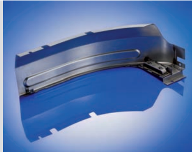
Einbaufertiges Seitenteil 1.128 x 455 x 315 mm | DC 04 t=1,5 mm