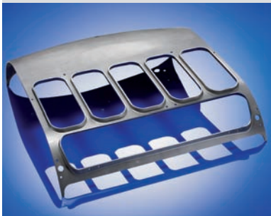
Schutzdach Flurförderzeug 981 x 923 x 266 mm | DD 14 t=5,0 mm