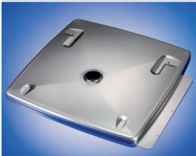
Funktionsteil mit Optikanspruch 688 x 655 x 55 mm | t=1,5 mm