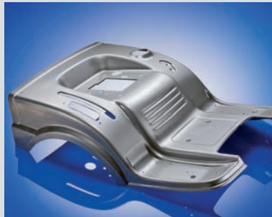
Sitzwanne für Gartentraktor 1.112 x 831 x 399 mm | t=1,5 mm

Mit großem Erfolg werden seit Jahren im Rahmen von Outsourcing-Projekten komplette Fertigungen übernommen. Der nahtlose Übergang wird durch unsere Projektteams sichergestellt.