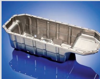
Ölwanne Off-Highway-Fahrzeuge 932 x 345 x 250 mm | DC06 t=2,0 mm