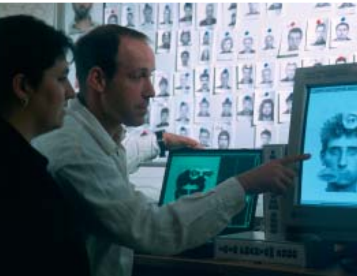
Ein erster Erfolg: In mühsamer Kleinarbeit wird das Phantombild des Täters angefertigt.

> Täter eine „gewisse Routine“ beim Töten hat. Tathergangsanalysen – auf Englisch Profiling – liefern wichtige Ermittlungsansätze zur Überführung des Täters. Manchmal sind die Ermittler gezwungen, vermeintliche Kleinigkeiten einer Tat aus dem Gesamtzusammenhang herauszutrennen und separat zu betrachten. Eine Methode, die sich nicht nur bei Serienmördern auszahlt. Beispiel: Bei einem Verkehrsunfall mit Todesfolge hat der flüchtige Fahrer das Fahrzeug nur wenige Kilometer vom Tatort in der Düsseldorfer Innenstadt abgestellt. Der Täter war jedoch nicht der Halter des Wagens, denn dieser hatte ein lupenreines Alibi.