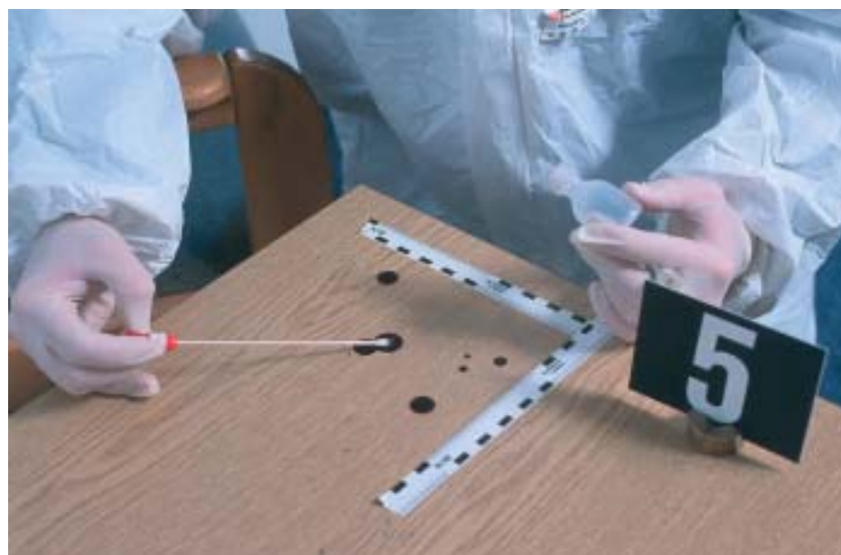
Voraussetzung für alle Fallanalysten: Penible Spurensicherung am Tatort.

Dabei gehen sie äußerst brutal und kaltblütig zu Werke, manche Opfer werden nach ausgiebiger Folter regelrecht hingerichtet. Als Täter konnten bislang 19 Mitglieder aus fünf Banden ausfindig gemacht werden.