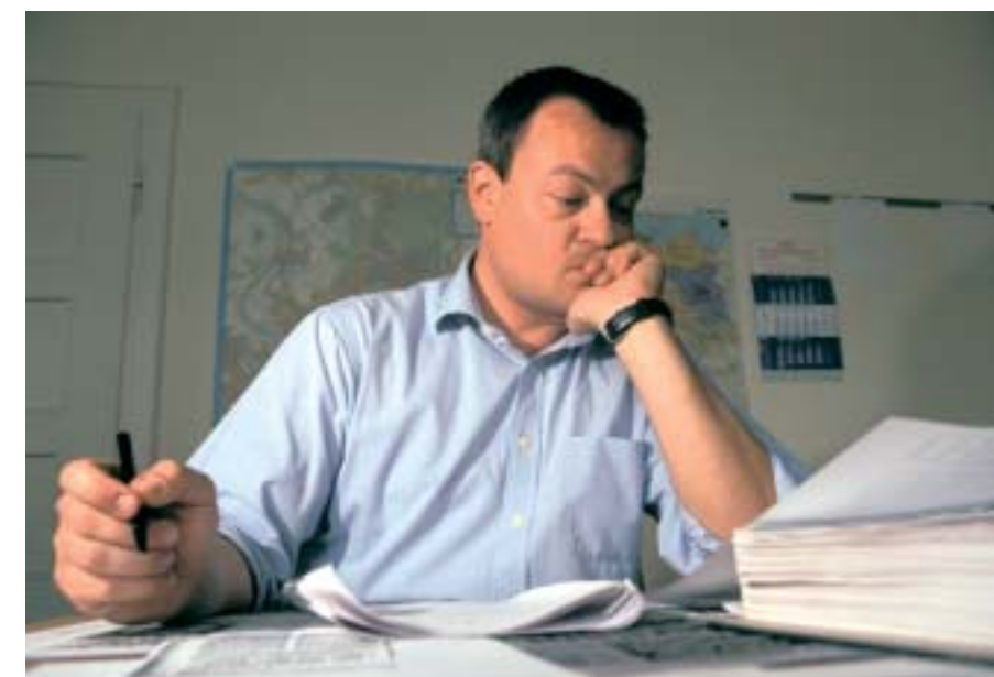
Alltag eines Fallanalysten: Peinlich genau werden alle Fakten zusammengetragen.