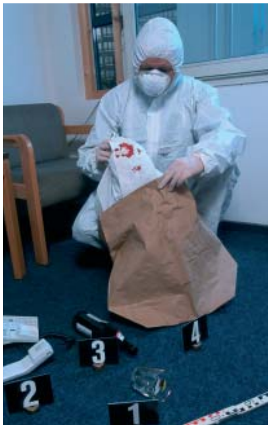
Wertvolles Beweismittel: Blutspuren am Tatort helfen den Ermittlern auch Jahre nach dem Mord, per DNA-Analyse Fälle zu lösen.

> schätzung heute revidieren. „Auch in Deutschland wird in Serie gemordet. Und nicht zu knapp. Zwischen 1945 und 1995 konnten 61 Serienmörder abgeurteilt werden, 54 Männer und sieben Frauen.“ Mindestens 21 Mordserien mit 79 Einzeltaten wurden nicht aufgeklärt. Die Zeitbombe tickt weiter. Bis zum nächsten Verbrechen. Die ernüchternde Bilanz des Kriminalisten: „Legt man diese Zahlen zu Grunde, dürfte Deutschland in diesem Deliktbereich einen Spitzenplatz einnehmen.“